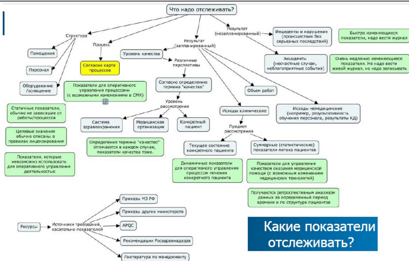
Рис.3. Пример комплексного подхода к формированию системы показателей.

На схеме прослеживаются основные принципы построения системы показателей. Структура оценочных критериев в её основе иерархична. На верхнем уровне отражается классическая триада качества с декомпозицией до каких-то конкретных измеряемых практически значимых вещей. Очень важны формулировки, они должны быть точными и ясными, а также пояснения, характеризующие тот или иной показатель, его суть, источники сведений и методы оценки. Также на схеме можно заметить отдельный блок с различными источниками требований, и отдельно он размещён неспроста. Суть в том, что различные своды требований интегрируются в систему показателей организации, а не подменяют её. Они принимаются в работу и встраиваются в систему показателей тогда, когда руководством организации принимается решение добиться соответствия в той или иной системе стандартов.