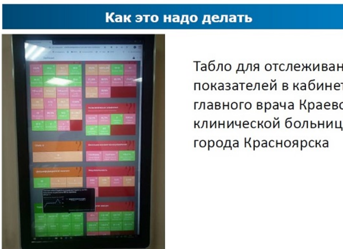
Рис.7. Пример интерфейса автоматизированной системы мониторинга показателей.

Здесь, несомненно, должны использоваться возможности автоматизации. Пример интерфейса автоматизированной системы мониторинга показателей, внедрённой в Красноярской краевой клинической больнице, приведён на рис.7. Система не только отображает состояние основных процессов в реальном времени, но и производит аналитическую обработку данных, что повышает их управленческую ценность.