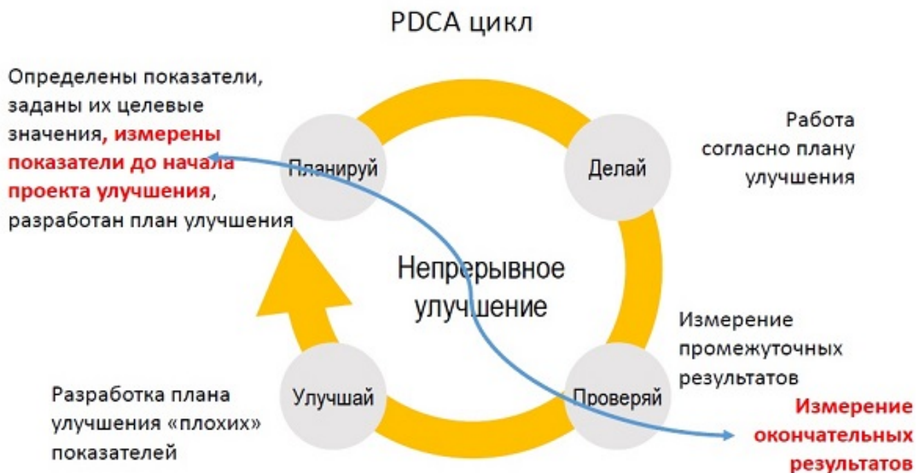
Рис.8. От мониторинга показателей – к управлению качеством.

Использование показателей и результатов их мониторинга должно приводить к улучшениям в деятельности организации, смысл состоит именно в этом.