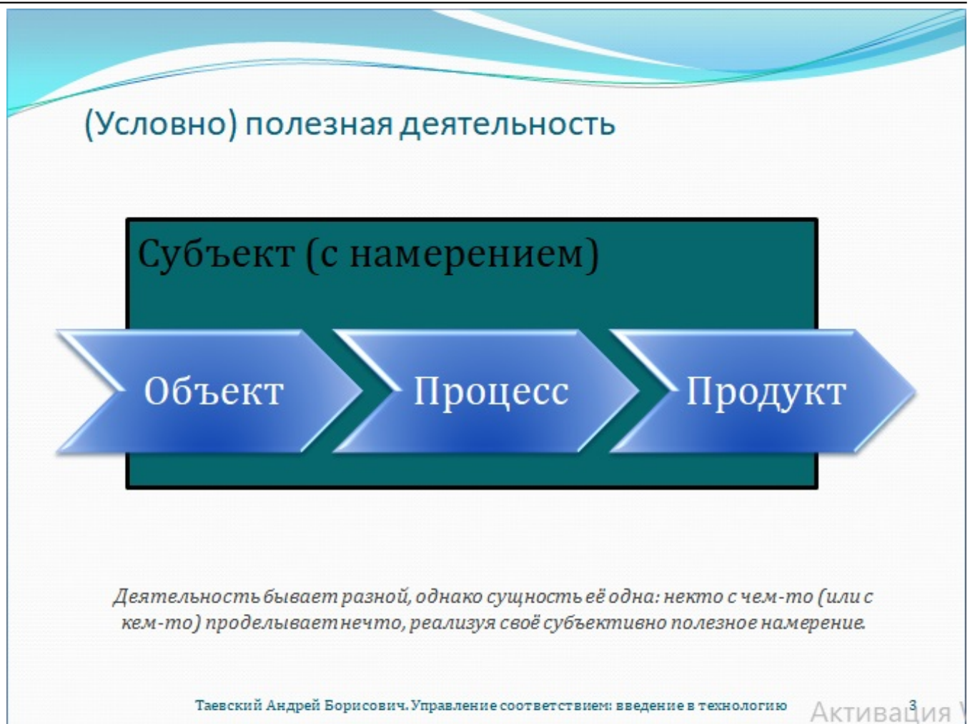
Рис. 3. (Условно) полезная деятельность

Впереди нас ждёт немало трудных вопросов, в которых предстоит совместно разобраться. Начнём, однако, с простых и понятных вещей, единственно ради того, чтобы синхронизировать наши мысли в правильном направлении. Любая целенаправленная деятельность, будь то ведение домашнего хозяйства, оказание медицинской помощи населению или консультирование по вопросам управления качеством, исполнена действиями, производимыми известными субъектами с некими объектами ради получения желаемых результатов – продуктов деятельности. Предположительно и субъективно полезной, конечно же. По общему