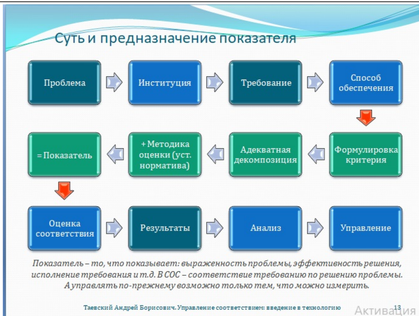
Рис. 13. Суть и предназначение показателя

Управление в отсутствие полных, объективных и достоверных сведений об объекте – профанация. Особенно, когда речь идёт о таких сложноустроенных и чувствительных к безалаберности объектах, как медицинская деятельность, здравоохранение и качество. Требования, вне зависимости от того, откуда исходят и в какие обеспечивающие институты включены, представляют собой готовые стандартные решения типичных проблем. Однако половинчатые, поскольку для того, чтобы то или иное требование включить в управление, необходимо сотворить из него показатель, дополнив его способом или методикой оценки исполнения.