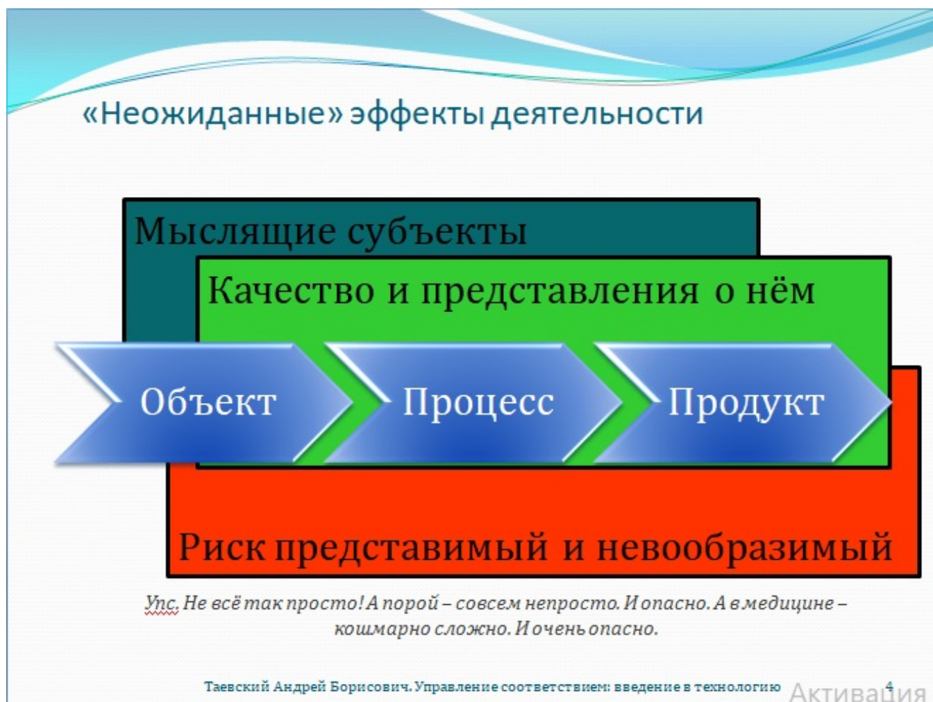
Рис. 4. «Неожиданные» эффекты деятельности