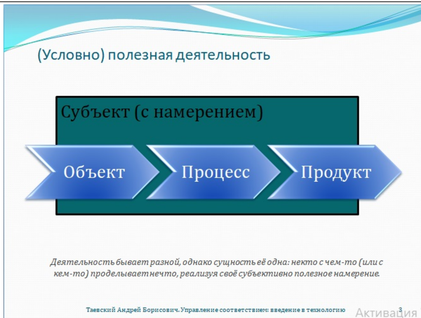
Рис. 3. (Условно) полезная деятельность

Впереди нас ждёт немало трудных вопросов, в которых предстоит совместно разобраться. Начнём, однако, с простых и понятных вещей, единственно ради того, чтобы синхронизировать наши мысли в правильном направлении. Любая целенаправленная деятельность, будь то ведение домашнего хозяйства, оказание медицинской помощи населению или консультирование по вопросам управления качеством, исполнена действиями, производимыми известными субъектами с некими объектами ради получения желаемых результатов – продуктов деятельности. Предположительно и субъективно полезной, конечно же. По общему