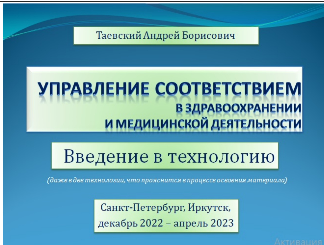
Рис. 1. Управление соответствием. Введение в технологию

Прежде, чем приступить к изложению материала, необходимо пояснить, зачем он создан и опубликован. Дело в том, что проблематика качества в здравоохранении и медицинской деятельности чрезвычайно сложна и туманна, особенно в своих прикладных аспектах. В то же время, вне контекста управления все разговоры о качестве бессмысленны. Управлять же можно только тем, что можно измерить, как известно и до сих пор никем не было оспорено. Этот материал, в основном, об аналитических инструментах, необходимых для управления качеством, и ещё о том, от чего зависит эффективность их применения. В этом видеоматериале я