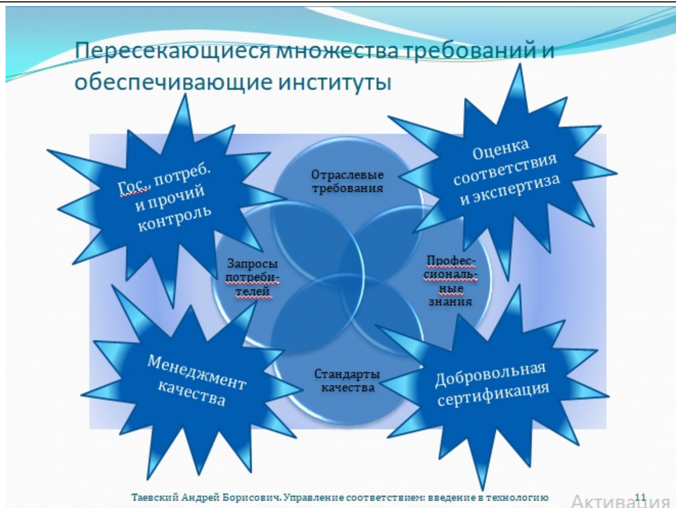
Рис. 11. Пересекающиеся множества требований и обеспечивающие институты

Требований много – так много, что охватить их все, пожалуй, жизни не хватит. Было бы странным, если бы их не пытались как-то аккумулировать и систематизировать. Что-то упорядочивается по линии отраслевого регулирования, что-то по линии профессиональных убеждений, что-то образует существо стандартов качества, а чего-то требуют потребители. Но чётких разграничений нет. Законодательство и наука, культура и менеджмент – это лишь фокусы внимания. Лучи прожекторов, выхватывающие из непостижимого океана естественных причинно-следственных отношений