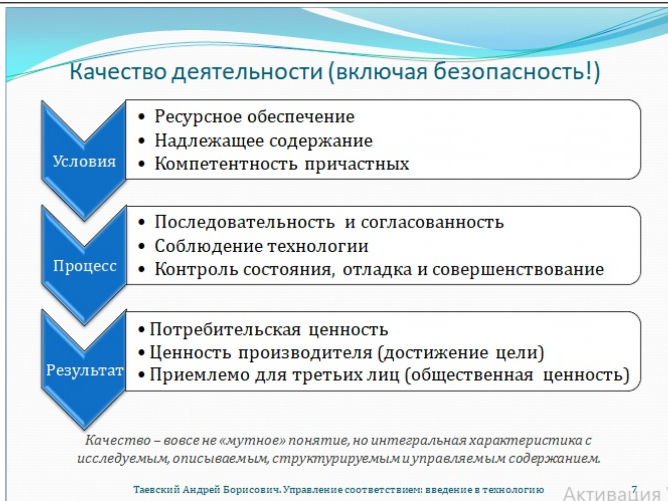
Рис. 7. Качество деятельности (включая безопасность!)

Общие принципы моделирования качества, безусловно, едины, однако наполнение может варьироваться. Конкретное содержимое всеобъемлющего понятия качества будет различаться в зависимости от того, к чему оно прилагается. Где-то одно будет важнее, где-то другое. Вопрос в том, как отразить важность того или другого аспекта, уравновесить вклад в качество каждой учитываемой позиции с её реальным значением. Об этом дальше ещё поговорим. Здесь же хотелось бы отметить неразрывную связь безопасности с качеством. Точнее, тот простой факт, что качество без обеспечения безопасности невозможно, немислимо. Есть, конечно,