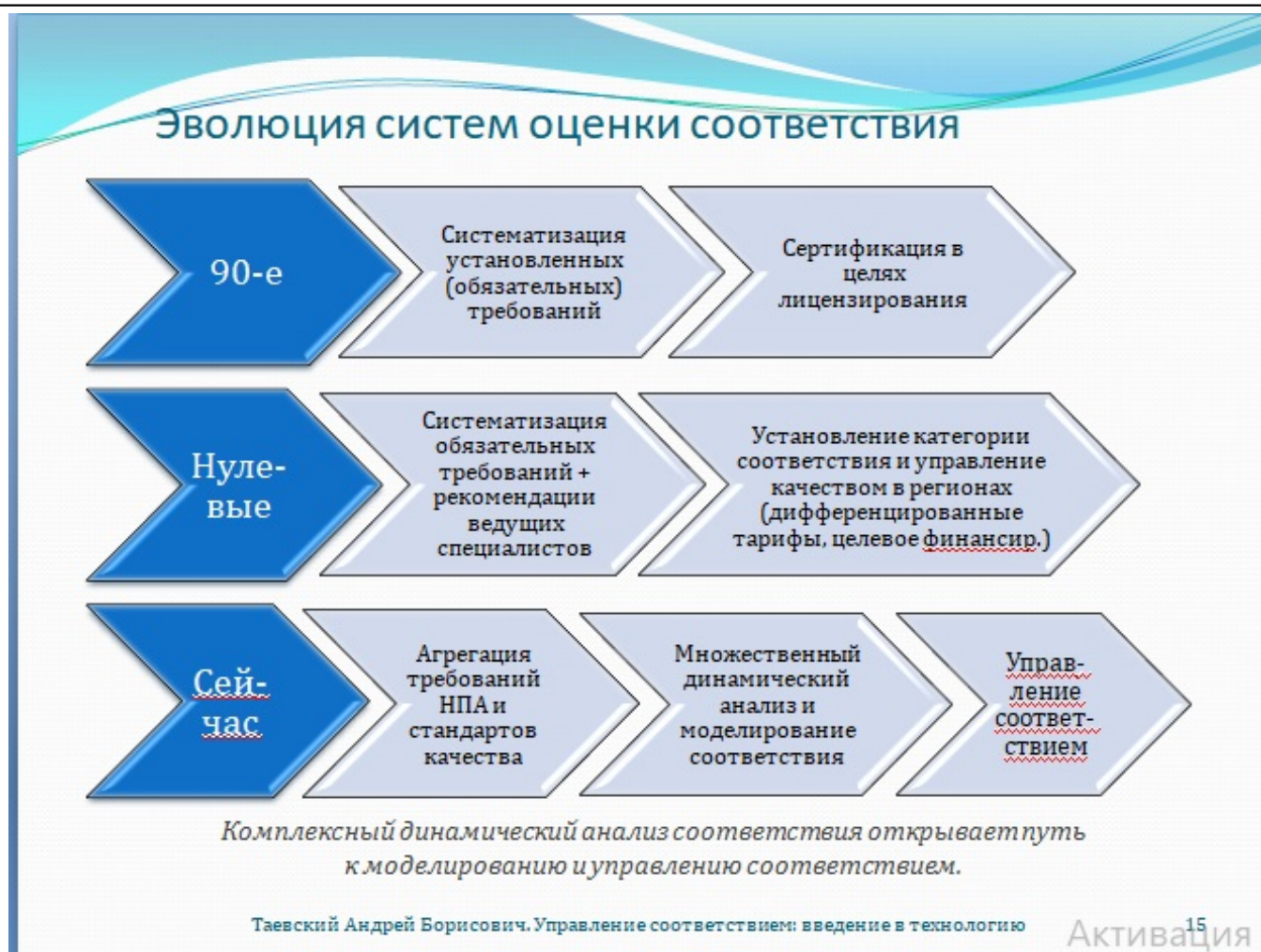
Рис. 15. Эволюция систем оценки соответствия

Системы оценки соответствия строились по-разному, но их объединяли системный подход и практическая направленность. Разработчики аккумулировали требования из разных источников, дифференцировали их, ранжировали, технологически и методически обеспечивали объективность результатов. Затем всё изменилось. Появился закон «О техническом регулировании», были внесены изменения в закон «О лицензировании отдельных видов деятельности» и «Основы законодательства Российской Федерации об охране здоровья граждан». Как следствие, произошёл разрыв разрешительной системы на две фактически изолированных области,