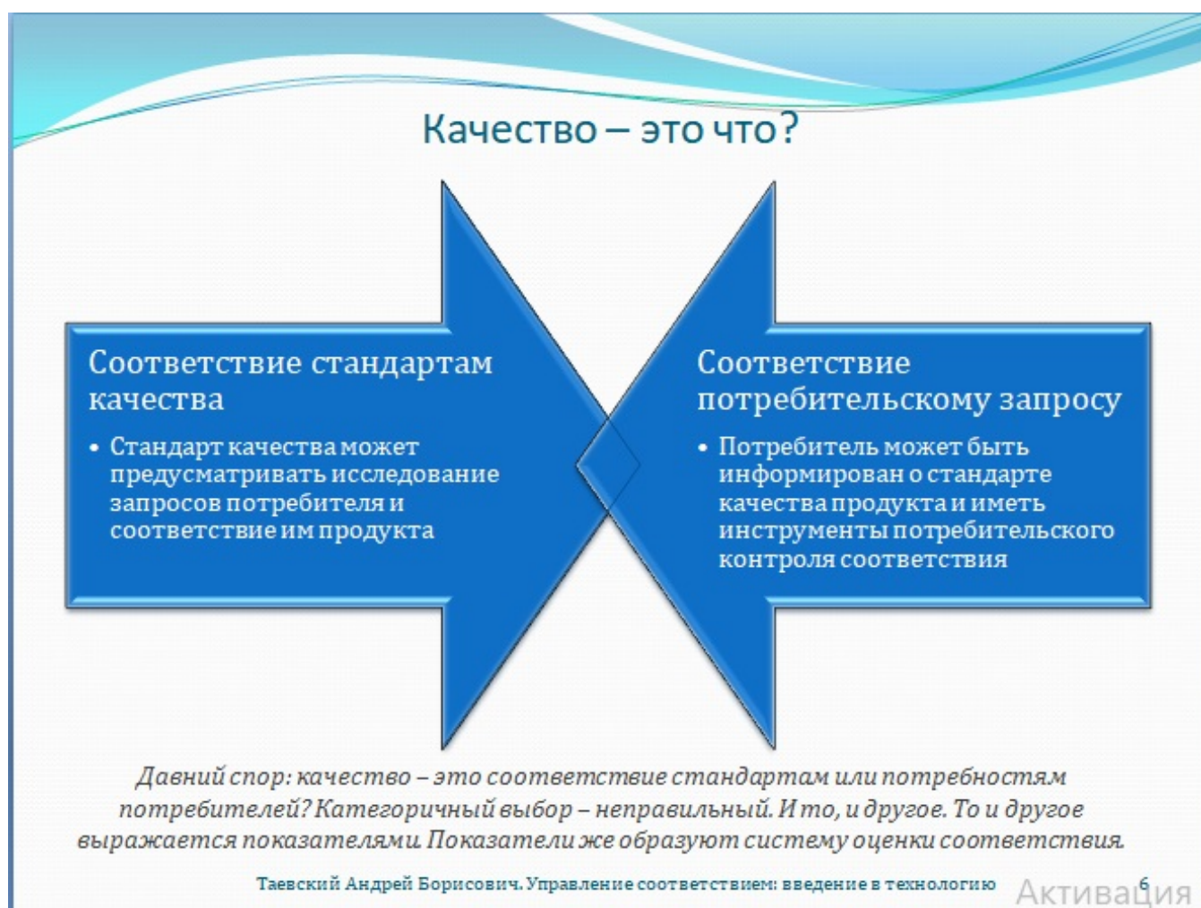
Рис. 6. Качество – это что?