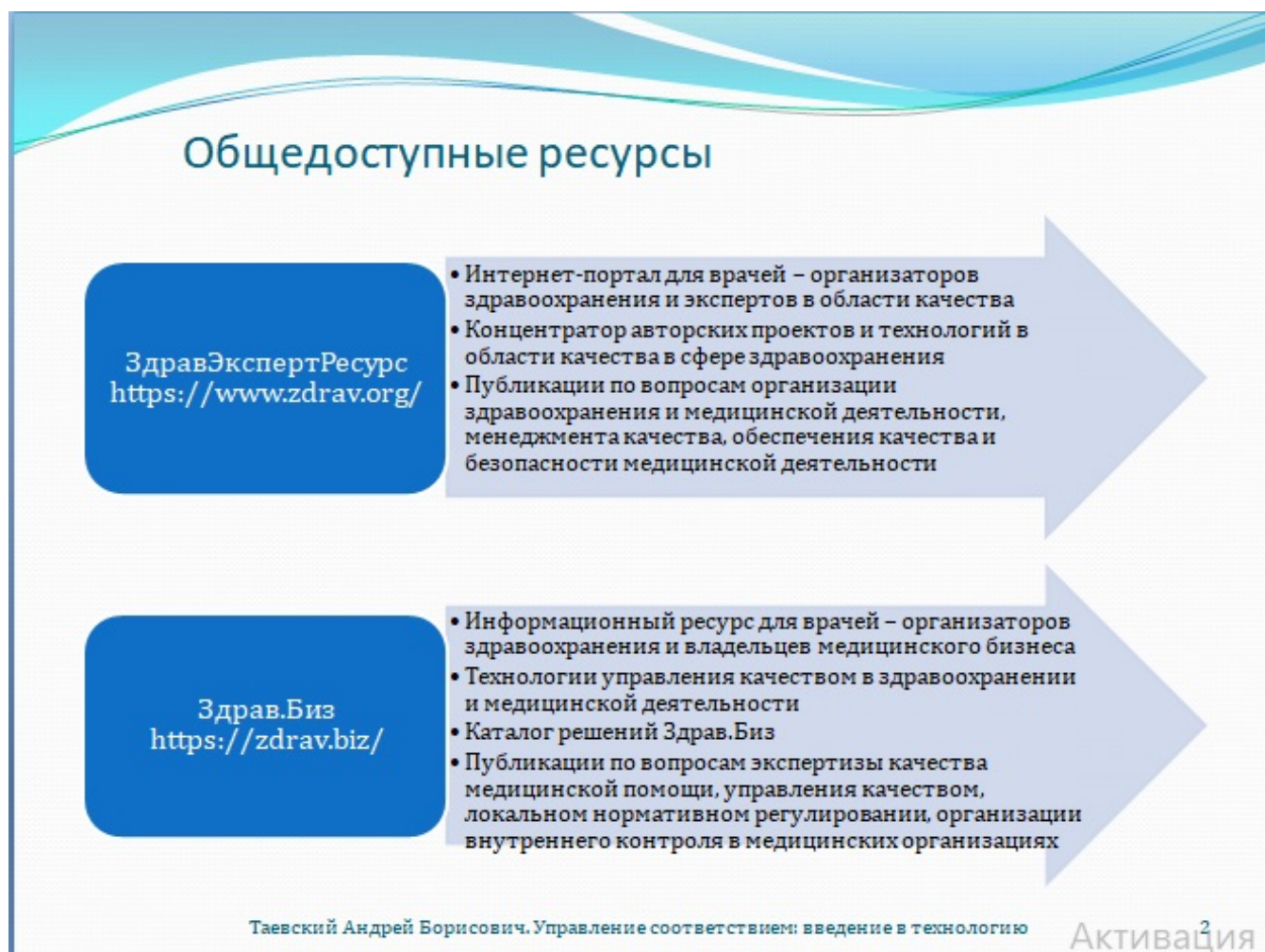
Рис. 2. Общедоступные ресурсы