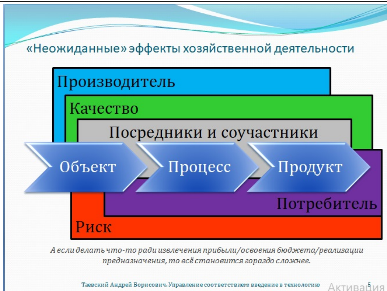
Рис. 5. «Неожиданные» эффекты хозяйственной деятельности

Всё становится ещё интереснее, когда деятельность участвует в распределении труда. Появляются роли – производителя и потребителя, посредника и поставщика, руководителя и работника, и т.д. Каждый соучастник деятельности – со своим пониманием миссии, цели, задач, принципов, правил осуществления, результатов деятельности, качества оных и права на риск. В зависимости от роли, которую играет человек в той или иной деятельности, а также его индивидуального опыта и других особенностей, различаются как его представления о различных сторонах дела, в т.ч. о качестве, так и его интересы. Указанные обстоятельства