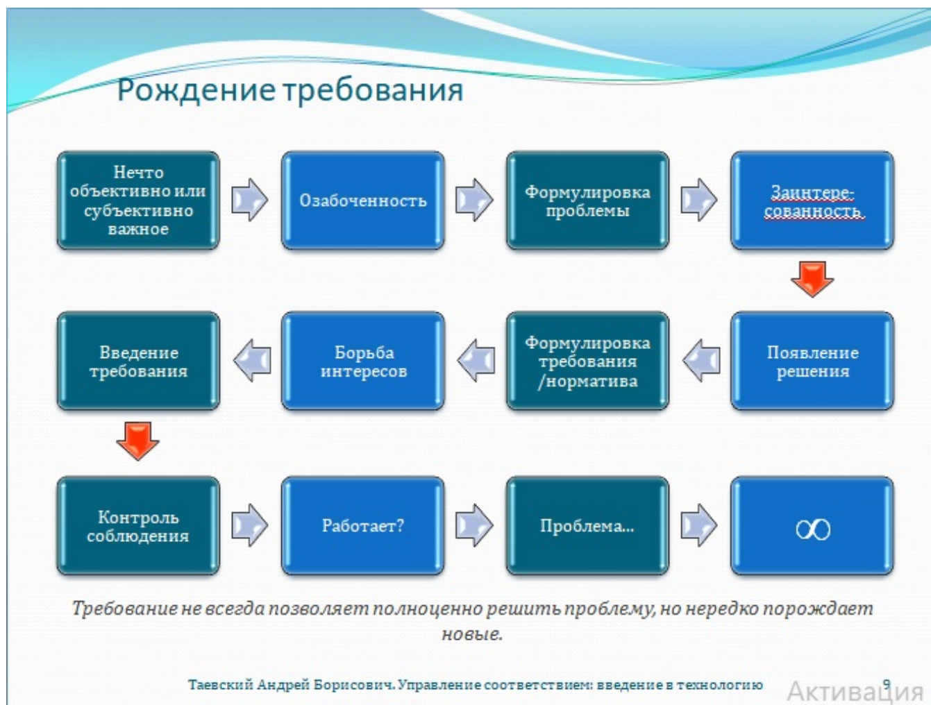
Рис. 9. Рождение требования

Хороший пример выработки и введения научно обоснованных требований, по крайней мере, в теоретической модели – клинические рекомендации. Они