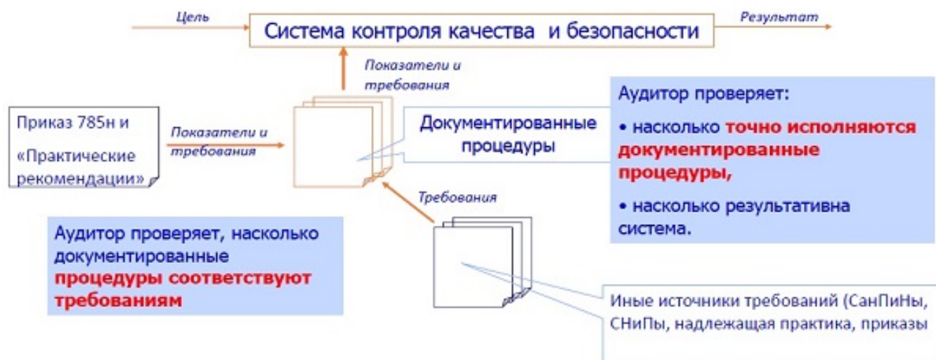
Рис.4. Принципиальная схема работы аудитора в медицинской организации.

Ну и, конечно, важны технологические аспекты проведения аудитов. Аудит начинается с постановки цели и к ней же возвращается в управленческом цикле. Т.е., аудит никогда не заканчивается. В процессе работы аудитор выясняет, насколько документированные процедуры соответствуют установленным требованиям и как точно они исполняются на деле. На рис.4 представлена принципиальная схема работы аудитора в медицинской организации. Конкретное её наполнение в каждом случае будет, конечно, своим.