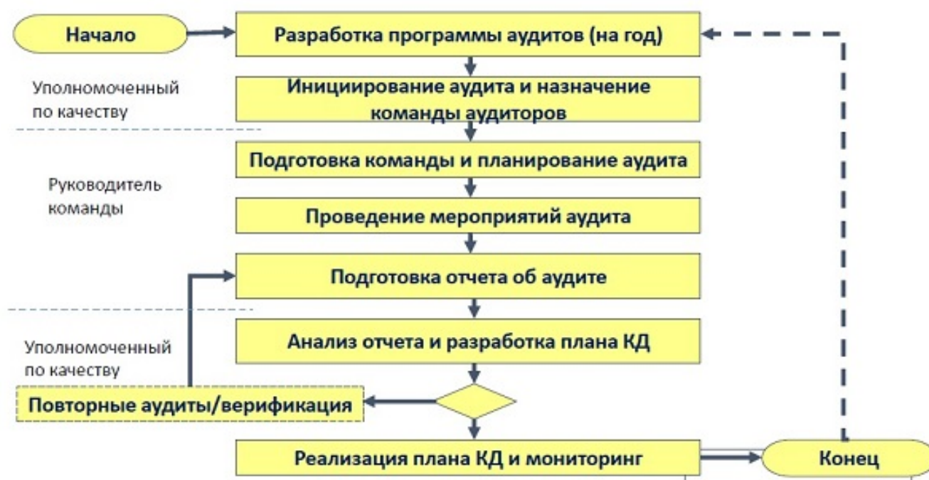
Рис.5. Алгоритм проведения аудитов в медицинской организации.

Служба качества или уполномоченное лицо при содействии руководства организации планирует эту работу, определяет цели и задачи аудитов, которые должны быть проведены в течение года, и формирует под них команды аудиторов. Руководители команд аудиторов планируют проведение аудитов, контролируют проведение всех запланированных мероприятий и оформляют результаты. Уполномоченный по качеству проводит анализ результатов и разрабатывает план корректирующих действий, реализуемый при содействии руководства организации. По мере необходимости, проводятся повторные аудиты и анализ эффективности корректирующих действий. Алгоритм проведения аудитов представлен на рис.5.