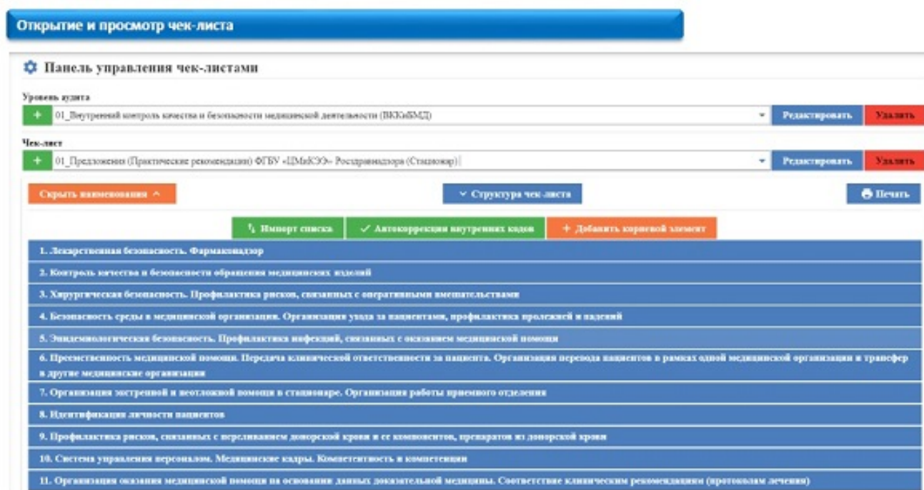
Рис.6. Функционал MKT-Web по выбору чек-листа нужной системы стандартов.

«ЭкспертЗдравСервис». В системе доступны для работы различные стандарты (рис.6).