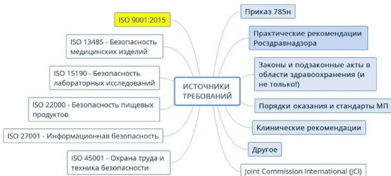
Рис.2. Пример ментальной карты привязки источников требований к процессам в медицинской организации.

Построение интегрированной системы управления в организации начинается с создания подобной ментальной карты. Нужно собрать воедино все требования, начиная с их источников, и отнести их с теми процессами, в рамках которых те или иные требования должны исполняться. В дальнейшем, должна производиться детальная проработка схемы, вплоть до конкретных требований и процессов. Например, так, как представлено на следующей схеме, где отражено только начало этой работы, но понятен принцип.