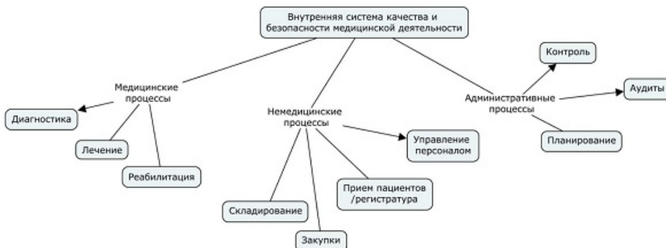
Рис.1. Три основных группы процессов в медицинской организации.

Процессы, составляющие ту или иную деятельность, могут быть сгруппированы на основе каких-то объединяющих признаков. В деятельности медицинской организации можно выделить три основных группы процессов: медицинские, немедицинские и административные. Каждая группа процессов может быть дополнительно уточнена примерно образом, как представлено на схеме, изображённой на рис.1.