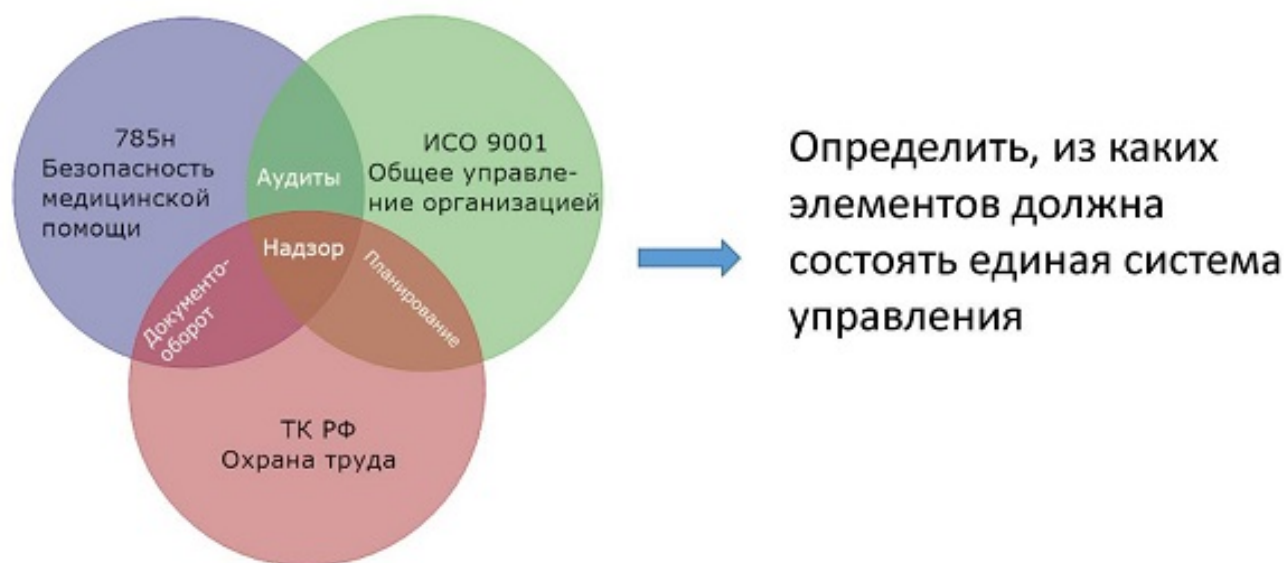
Рис.4. Примерная схема пересечения требований с выходом на интеграцию системы.

Применение любых систем стандартов и других систематизированных требований предполагает ведение документации, планирование мероприятий, аудит или иные проверки, а также контроль исполнения и анализ результатов. На этих универсальных узлах и должна выстраиваться единая интегрированная система управления. А проработку тех требований, что являются самостоятельными, можно уже поручать рабочим