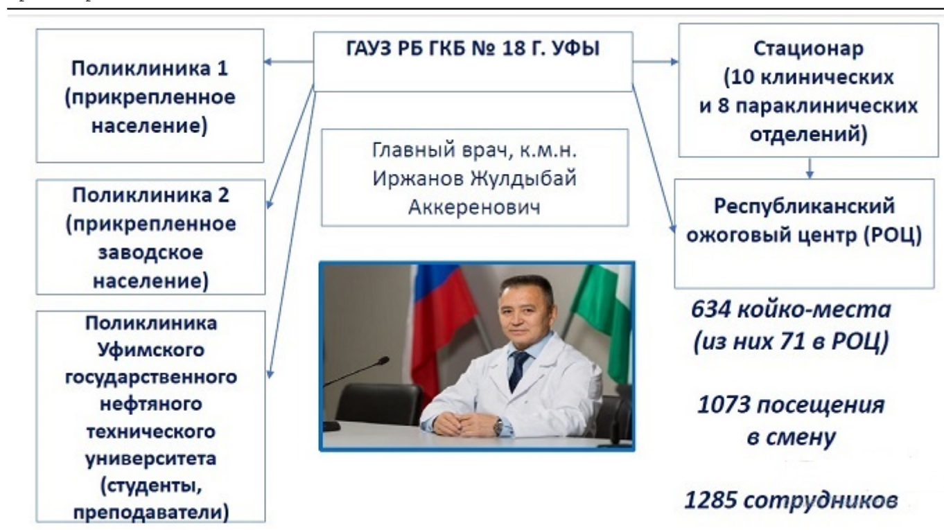
Рис. 3. Государственное автономное учреждение здравоохранения Республики Башкортостан Городской клинической больницы № 18 города Уфы.

В ГАУЗ РБ ГKB № 18 г.Уфы изначально был взят курс на создание интегрированной системы менеджмента качества (ИСМК), отвечающей требованиям международных, национальных и отраслевых стандартов в области менеджмента качества и функционирующей, как единое целое. Были определены и отражены в приказах главного врача цели и задачи проекта, назначен его руководитель, сформирована его команда, созданы рабочие группы по основным направлениям менеджмента качества и безопасности медицинской деятельности.