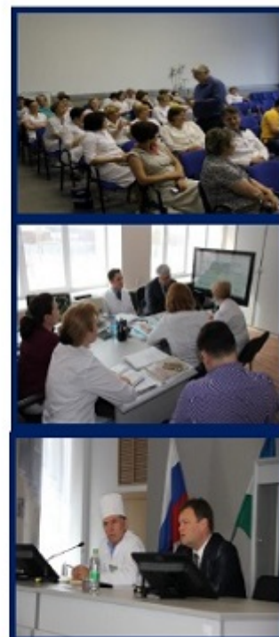
Рис. 8. Основные препятствия на пути реализации проекта по внедрению системы менеджмента качества в ГАУЗ РБ ГКБ № 18 г.Уфы.

Команда проекта в ГАУЗ РБ ГКБ № 18 г.Уфы также столкнулась с рядом препятствующих обстоятельств, но была к ним морально готова. Активная позиция руководства больницы, целенаправленные усилия команды проекта, помощь грамотных консультантов позволили добиться полной вовлечённости коллектива в благое и ответственное дело улучшения качества и повышения безопасности медицинской деятельности и оказываемой пациентам медицинской помощи.